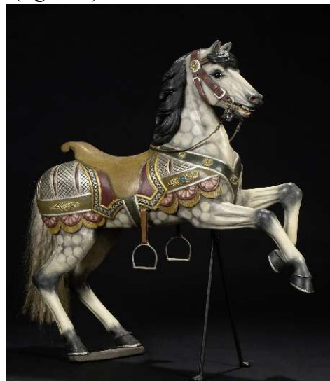
3) Cheval cabré, cheval allemand, l'arrière du tapis de selle sont allongés (figure 1). Poeppig, 1910.

Les sculpteurs s'inspirent pour la conception des chevaux de bois, des races en vogue à la même période. Ils donnent à leurs chevaux une attitude directement inspirée des méthodes employées en équitation dans chaque pays. Mais les sculpteurs livrent souvent une image idéalisée du cheval. Les sauteurs ou galopants sont conçus avec les membres en extension, « une représentation imaginaire, idéalisée, d'un galop à quatre temps que les peintres et les illustrateurs ont transmis durant des siècles », en attendant la photographie... Pour le français Gustave Bayol, il s'agit de tendre vers une savante domination du cheval, tout en lui donnant l'apparence de la liberté. Le sculpteur représente ainsi le cheval doté souvent d'une robe blanche unie, d'une queue en bois, d'une crinière travaillée avec une mèche de toupet sur le front, entre les deux oreilles. Le harnachement est constitué d'un tapis de selle, d'une selle à l'anglaise (sans troussequin), d'un collier de chasse à marguerites et pompons, d'une barre de ruade en forme de flèche avec une marguerite. Les pompons présents sur le collier de chasse et à