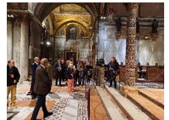
Basilique San Marco

Le programme du jeudi 19 a débuté par la visite guidée de la grande école de Saint Rocco (confrérie laïque fondée en 1478 qui continue aujourd'hui d'accomplir des devoirs caritatifs et qui permet aux visiteurs d'admirer plus de 60 peintures de maîtres), puis de la basilique de Sainte Marie Glorieuse des Frères et de ses nombreuses œuvres du Titien. La journée s'est continuée par un déjeuner au Bacaro do Mori puis par un après-midi libre et une visite privée à 19h30 de la basilique cathédrale Saint Marc. Le dîner a été offert au cercle des carabiniers de Venise et suivi d'une aubade de deux gondoliers.