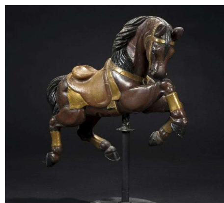
2) Petit cheval fixe, cheval français, H. Devos, vers 1890

Le style français se veut naturaliste (figures 1 et 2). Les sujets sont ainsi caractérisés par un grand sens du mouvement, des modelés accusés, une finesse des reliefs décoratifs, sans ornements superflus mais avec un soin particulier porté à l'expression de la face. En Allemagne, les chevaux de bois sont empreints de noblesse et présentent des ornements somptueux (figure 3).