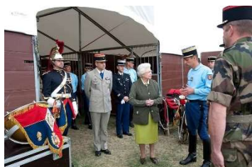
Rencontre avec la fanfare à Windsor en 2011