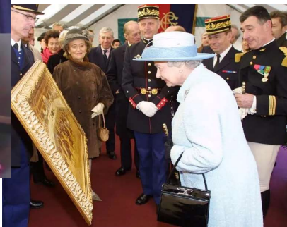
Visite au quartier des Célestins - mai 2004