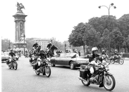
Première visite d'Etat à Paris en tant que Reine au mois d'avril 1957