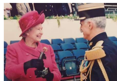
Avec le commandant de régiment à Windsor le 18 mai